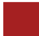
Rouge Poste GB