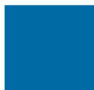
Bleu EDF 1987