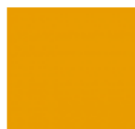
Jaune Or RAL 1004